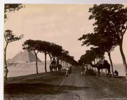
6. Lékégian, Route des Pyramides

Selon « l'enquête Patrimoine » lancée en 2008 par le MESR, l'iconographie constitue l'une des principales terrae incognitae patrimoniales en bibliothèques. Cet atelier traitera des questions spécifiques soulevées par les documents et ensembles de documents iconographiques.