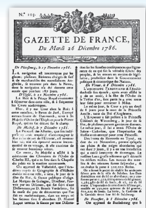
«La gazette de France» le premier journal paru en France