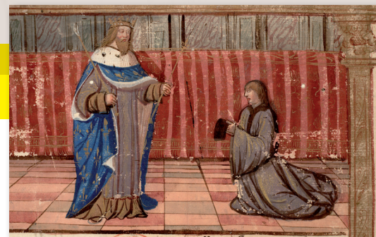
Institut de France, Ms Godefroy 321 Réserve (miniature xv e s.)